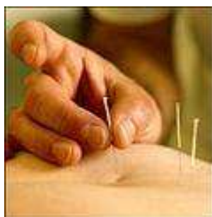
Agopuntura per il dolore. Una revisione

Uno sforzo immane per le categorie sanitarie